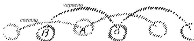
Табела 6 и 7

Да, но онези, които живеят 50 години по-късно от вас, те също са били в предишния земен живот заедно с някои хора! Общо взето, според тази мисъл, която развихме тук, хората от редицата В не ще се срещнат с хората от редицата А. Това е една подтискаща мисъл, но една вярна мисъл.